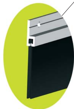
Joint brosse extérieur sur panneaux