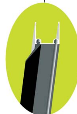
Joint à lèvres vertical sur panneau côté refoulement si écoinçon ≤ 600 mm