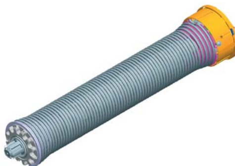
Vue du moteur Optimax 133 sans le tube